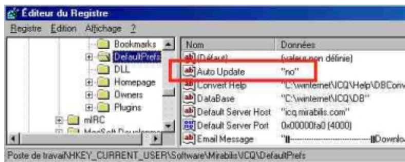
Désactivation du mouchard

Enfin, si vous ne vous sentez pas de taille à affronter la base de registration de Windows, vous pouvez utiliser un utilitaire qui fera le travail tout seul. Citons pas exemple l'excellent Hulk Maximizer qui, sous l'onglet « Mouchards », se propose de supprimer ce dernier.